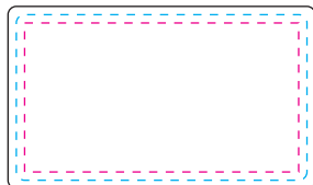
長方形 35 \times 20\text{mm} (ゴルフマーカー クリップ部)